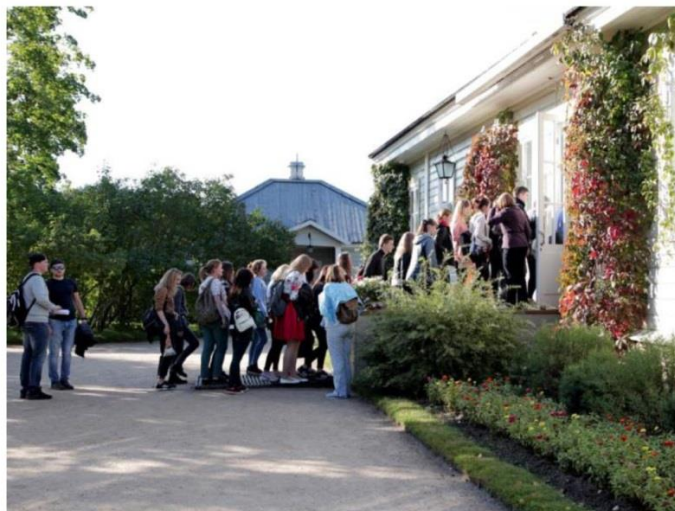
ЭКСКУРСИЯ В ДОМ-МУЗЕЙ А. С. ПУШКИНА.

«7 июля с.г., несмотря на ненастную погоду, с удовольствием посетили усадьбу «Михайловское» и познакомились с ее окрестностями. Большое спасибо нашему экскурсоводу Марии за ее очень интересный