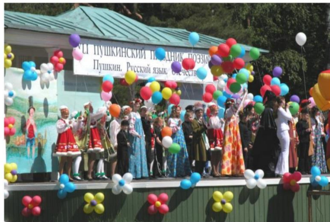
XII ПУШКИНСКИЙ ПРАЗДНИК ПОЭЗИИ. ФОТО Н. В. АЛЕКСЕЕВОЙ

Пушкинский праздник поэзии – это воспитание чувств его участников. Красота поэтического места, его живая изменчивость, открытость, говорят о бесконечности