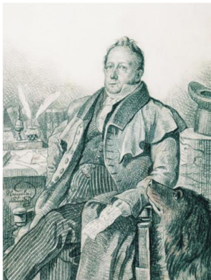
СЕРГЕЙ ЛЬВОВИЧ ПУШКИН. КОПИЯ НЕИЗВЕСТНОГО ХУДОЖНИКА 1936 г. С ОРИГ. К. ГАМПЕЛЬНА 1824 г. ИЗ ФОНДОВ ПУШКИНСКОГО ЗАПОВЕДНИКА

А. И. Яцимирский считает, что по поводу «деликатного» духовного надзора над поэтом переписки среди лиц власть имущих могло и вовсе не существовать. Отсюда он делает вывод, что Пушкин, «сданный на поруки