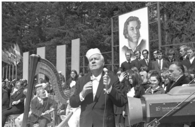
VI ВСЕСОЮЗНЫЙ ПУШКИНСКИЙ ПРАЗДНИК ПОЭЗИИ. МИХАЙЛОВСКОЕ ВЫСТУПЛЕНИЕ н. а. СССР И. С. КОЗЛОВСКОГО. 4 ИЮНЯ 1972 г.

Пушкинский праздник поэзии меняет свой формат. Он остается верен имени Поэта, остается поэтическим посланием современникам. И все же, будучи живым явлением русской культуры, меняется вместе с нами, его организаторами и участниками. В год 220-летия со дня рождения Александра Сергеевича новое имя открывает современные горизонты старейшего литературного фестиваля – «Праздника Пушкинской поэзии и русской культуры».