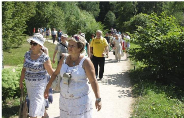
«ЗА ЭКСКУРСОВОДОМ».

Одна из самых востребованных музейных профессий – экскурсовод. Его работа интересная, творческая, ответственная и в то же время нелегкая. Как во многих других профессиях, в ней есть свои сложности. Экскурсии проводятся не только в музеях, но и под открытым небом: шагай вместе с экскурсантами по тропам и дорогам Пушкинского Заповедника то в сильный мороз, то под палящим солнцем, то под проливным дождем. Говорить приходится и в ветреную, и в морозную погоду, да так, чтобы всем было хорошо слышно. Экскурсовод должен быть выносливым (часто можно остаться без обеда) и терпеливым (туристы бывают самыми разными). Немаловажную роль здесь играет и его коммуникабельность, поскольку необходимо в короткий срок установить контакт с группой людей разных возрастов и интересов. Не помешает хорошее чувство юмора, умение безболезненно решать конфликтные ситуации.