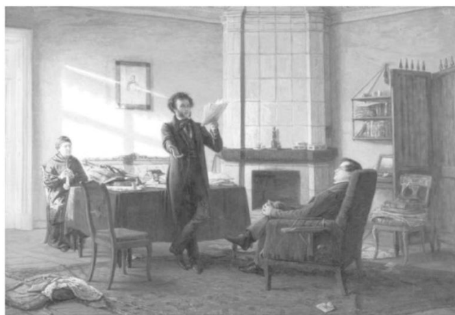
Н. Н. Ге. «Пушкин в Михайловском». Фото с картины 1875 г. из фондов Пушкинского заповедника

Н. Н. Ге было дорого национальное прошлое России, и он написал ряд исторических полотен. Среди них такие как «Петр I допрашивает своего сына» (1871 г.), «Екатерина II у гроба Елизаветы» (1874 г.), «Пушкин в Михайловском» (1875 г.).