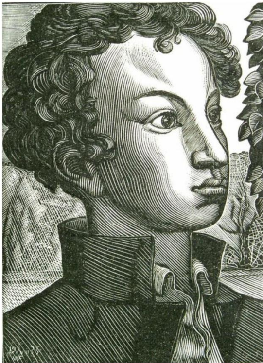
В. А. ФАВОРСКИЙ. ПУШКИН-ЛИЦЕИСТ. 1935. ИЗ ФОНДОВ ПУШКИНСКОГО ЗАПОВЕДНИКА

Мы продолжаем публикацию высказываний о Пушкине в стихах и прозе, объединенных общей темой, связанной с его поэтическим детством и детством, юностью, зрелостью тех, кто о нем говорит – с восхищением, признательностью и любовью. За одним исключением, все они представляют «Настоящий Двадцатый Век» (Ахматова), ставший принадлежностью истории, но оставивший нам возможность заинтересованного, изучающего, благодарного вслушивания и всматривания. А поэтическое имя, представляющее новый век и заключающее подборку, выбрано, как увидит читатель, тоже не случайно.