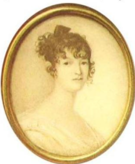
К. ДЕ МЕСТР. Н. О. ПУШКИНА. 1800-е

В этот день, как ни в какой другой, мы много рассказываем гостям Заповедника о матери поэта. Письма друзей Пушкина донесли до нас ценную информацию об отношении Надежды Осиповны к сыну. После возвращения Пушкина из ссылки Антон Антонович Дельвиг писал ему из Петербурга: «Как счастлива семья твоя, ты не можешь представить! Особенно мать, она наверху блаженства». Софья Михайловна, жена Дельвига, в мае 1827 года, рассказывая в письме подруге, что родители Пушкина радуются свободе сына, добавляла: «Надежда Осиповна плакала, как ребенок, и всех нас растрогала». Анна Петровна Керн в «Воспоминаниях о Пушкине» писала: «...он иногда заходил к нам, отправляясь к своим родителям. Мать его, Надежда Осиповна, горячо любившая детей своих, гордилась им и была очень рада, когда он посещал их и оставался обедать. Она заманивала его к обеду печеным картофелем, до которого Пушкин был большой охотник. В год возвращения его из Михайловского именины свои праздновал он в доме родителей, в семейном кружку, и был очень мил».