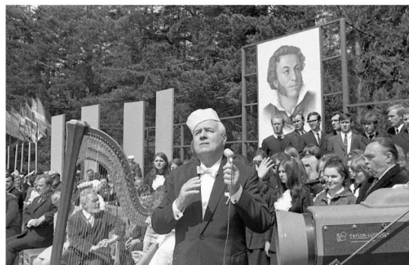
И. С. КОЗЛОВСКИЙ, 4 ИЮНЯ 1972 г.

домашних библиотек. Да еще на книгах ставили памятную печать с порядковым номером Праздника поэзии и датой. А еще на праздник приезжали знаменитости: поэты, писатели, имена которых были на слуху у всех, в Святогорском монастыре и на михайловской эстраде пел знаменитый Иван Козловский! Поэты и писатели выступали и покидали эстраду, где нещадно палило июньское солнце, спускались по ступенькам, чтобы отдохнуть в благодатной тени, и вот тут-то надо было не опоздать и успеть в толпе желающих получить автограф на заранее купленной на ярмарке книге! А потом, в школе, рассказывать, чьи автографы удалось получить в этом году.