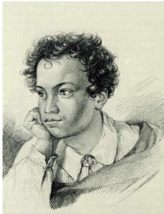
Е. И. ГЕЙТМАН. А. С. ПУШКИН. 1822.

Сначала слышалось только: «Бу-бу-бу...». Это большие бабушкины губы бубнили над непрочным детским теменем, извещая его о грядущей истине, о радости, дарованной всем ни за что ни про что, просто за заслугу рождения. Потом, в сиротстве эвакуации, бормотание проявилось в слова – до сих пор пугаюсь их нежной и безвыходной жути: «Буря мглою небо кроет...».