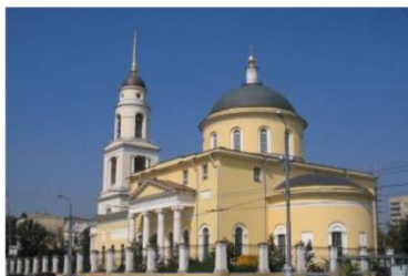
ЦЕРКОВЬ ВОЗНЕСЕНИЯ ГОСПОДНЯ В СТОРОЖАХ У НИМИТСКИХ ВОРОТ

Пасха, Вознесение, Троица – пожалуй, сейчас уже все знают, что это подвижные праздники церковного календаря и что все они приходятся на весенне-летнее время. Но мало кто задумывался, что у семьи Пушкиных с ними связаны особые чувства.