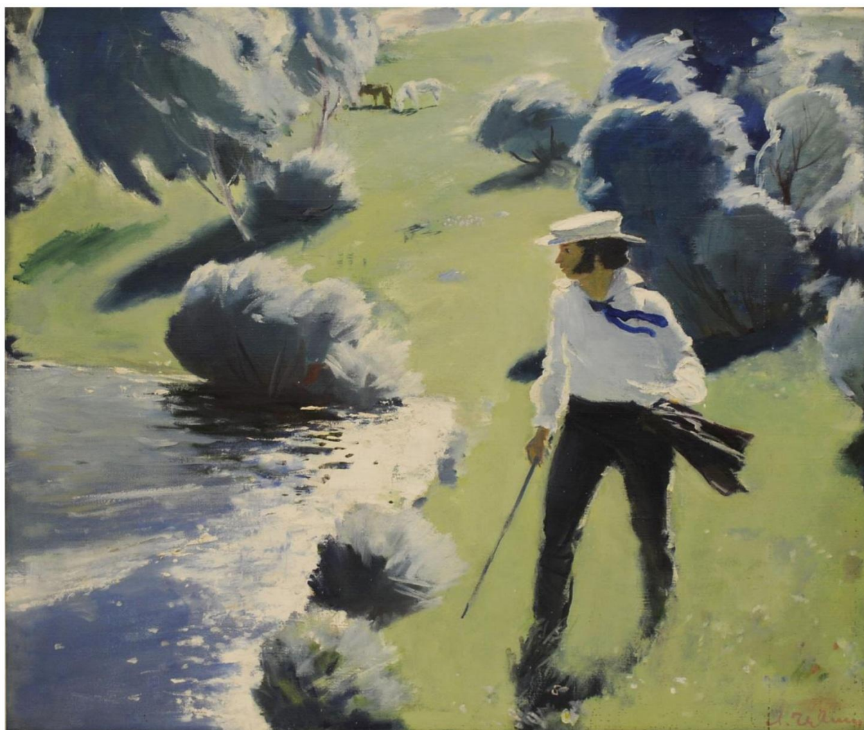
Л. В. ГЕРВИЦ. ВОСПОМИНАНИЕ О ТРИГОРСКОМ. 1978. ИЗ ФОНДОВ ПУШКИНСКОГО ЗАПОВЕДНИКА