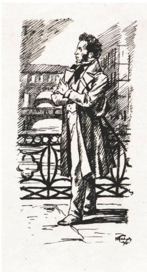
М. ПАВЛОВ. А. С. ПУШКИН. 1936.

Зачем мне знать, что называлась Мья, Для лодок в берега вбивали колья... Есть признак места, выраженный болью. Боль – от и – до. И это знаю я. От Красного – к Конюшенному. Вот Где стык углов и стык белил и охры Сжимает узко берега и горло И внешней правдой быть перестает.