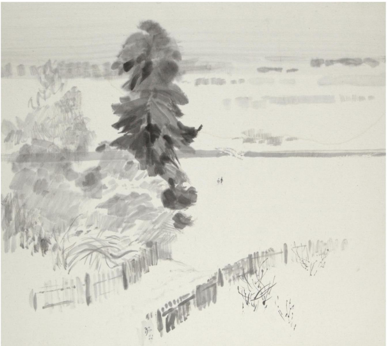
В. М. ЗВОНЦОВ. ТИШИНА НАД СОРОТЬЮ. 1992. ИЗ ФОНДОВ ПУШКИНСКОГО ЗАПОВЕДНИКА