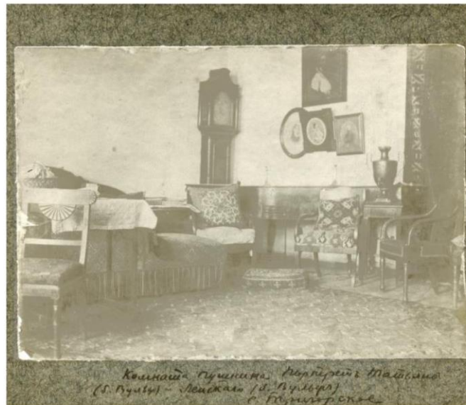
ТРИГОРСКОЕ. «КОМНАТА ПУШКИНА». С ФОТО С. С. ЩЕРБАКОВА 1918 г. На нижнем поле пастарту надпись: «Комната Пушкина. Портрет Татьяны (б. Вульф) и Ленского (б. Вульф) / с. Тригорское»

2 января 2017 года в «Классной» Дома-музея Осиповых и Вульфов в Тригорском открылась камерная тематическая выставка. Она знакомит посетителей с уникальными архивными документами по истории усадьбы конца XIX – начала XX вв., поступившими в фонды музея спустя двадцать лет после восстановления и открытия тригорского дома, а также с редко вы-