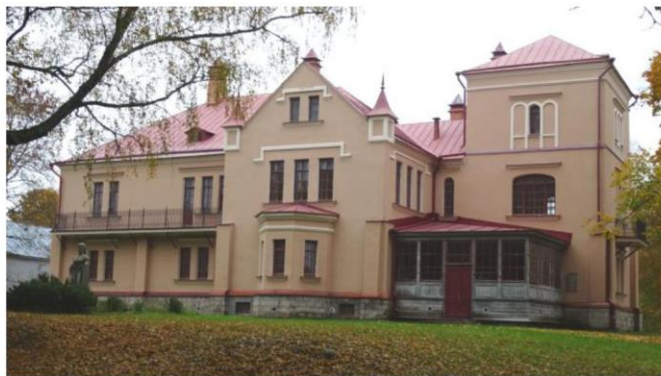
ДОМ В ПОЛИБИНЕ. ВИД ИЗ ПАРКА. 2016.

Во главу этой заметки поставлено название выставок, которые Пушкинский Заповедник будет открывать 8 и 10 февраля в двух местах. Первое – Полибино, мемориальный музей-усадьба Софьи Ковалевской, известной всем как первая в мире женщина, получившая звание профессора математики. Второе – посольство Российской Федерации в Стокгольме, где университетским научным сообществом были по достоинству оценены математические способности русской ученой. Идея создания этой выставки родилась летом 2016 года во время обсуждения планов сотрудничества между Российским посольством в Швеции и Пушкинским Заповедником.