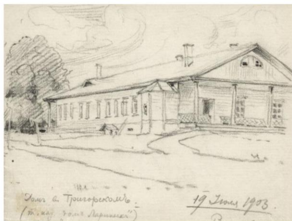
Н. Е. ЛАНСЕРЕ. РИСУНОК ИЗ ПИСЬМА К МАТЕРИ ОТ 19 ИЮЛЯ 1903 ГОДА

Д. С. Плотникова, главный хранитель музейных предметов