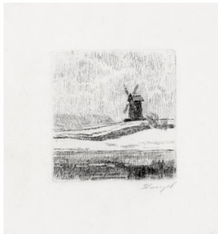
ОФОРТЫ-МИНИАТЮРЫ В. М. ЗВОНЦОВА ИЗ СОБРАНИЯ ПУШКИНСКОГО ЗАПОВЕДНИКА