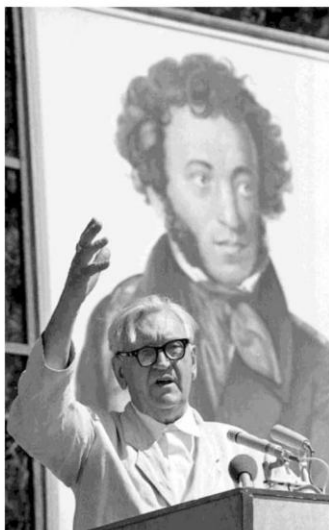
Июнь 1979.