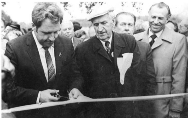
ТОРЖЕСТВЕННОЕ ОТКРЫТИЕ МУЗЕЯ В ЦЕНТРЕ С. С. ГЕЙЧЕНКО.

К истории открытия музея «Водяная мельница в д. Бугрово»