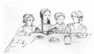
ДЕТИ А. С. ПУШКИНА. СПЕВА НАПРАВО: ГРИГОРИЙ, МАРИЯ, НАТАЛИЯ, АЛЕКСАНДР. РИСУНОК Н. И. ФРИЗЕНГОФ ИЗ АЛЬБОМА Н. Н. ПУШКИНОЙ МИХАЙЛОВСКОЕ 10 АВГУСТА 1841 ГОДА

Г. Н. Пиврик, главный хранитель музейных лесов и парков