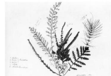
РАСТЕНИЯ, СОБРАННЫЕ В МИХАЙЛОВСКОМ ЖЕНОЙ И ДЕТЬМИ ПУШКИНА