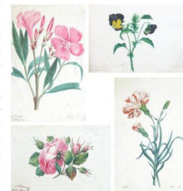
ЦВЕТЫ ИЗ АЛЬБОМА А. ЮРЕНЕВА