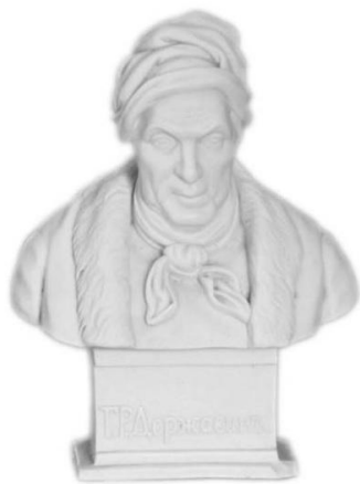
Г. Р. Державин. XIX в. Бюквит из собрания Пушкинского Заповедника

Год назад мы отмечали 200-летие знаменитого лицейского экзамена, во время которого юный Пушкин увидел прославленного поэта и читал перед ним свои «Воспоминания в Царском Селе». «Державина видел я только однажды в жизни, но никогда того не забуду», – вспоминал он двадцать лет спустя. Тот же 1815 год связан с публикацией пушкинского стихотворения, первого из напечатанных под полным именем автора. В главе восьмой «Евгения Онегина», делаясь с читателем своим первоначальным поэтическим переживанием, связанным с явлением музы, Пушкин писал: