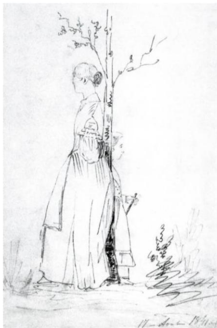
Н. И. ФРИЗЕНГОФ. НАТАЛЬЯ НИКОЛАЕВНА ПУШКИНА С ДОЧЕРЬЮ МАРИЕЙ. 1841

В июне 2016 года в Михайловском в 10-й раз будет проводиться усадебный праздник в честь дня рождения матери поэта. Традиционно в этот день в господском доме выставляется мемориальная семейная икона, которой умирающая Надежда Осиповна благословила свою старшую внучку Марию Пушкину. А запись об этом событии на обороте иконы сделана рукою Натальи Николаевны Пушкиной.