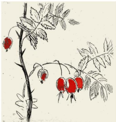
В. М. ЗВОНЦОВ. ШИПОВНИК. 1976 ИЗ ФОНДОВ ПУШКИНСКОГО ЗАПОВЕДНИКА