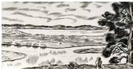
В. Ф. АЛЕКСЕЕВ. САВКИНА ГОРКА. 1984