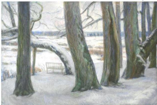
АЛЕКСАНДРА ПАВЛОВА. «СКАМЬЯ ОНЕГИНА». 2015

Приезжая в Пушкинский Заповедник в самую суровую зимнюю пору, молодые художники каждый раз заново открывают для себя дорогие сердцу каждого образованного человека места, связанные с поэтическим гением Пушкина.