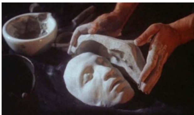
КАДР ИЗ ФИЛЬМА «ПОСЛЕДНЯЯ ДОРОГА»

Материалы подготовил Н. А. Алексеев, ведущий специалист службы информации