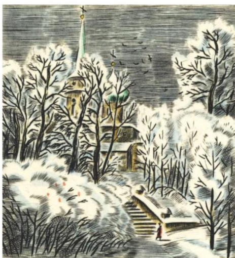
В. Ф. АЛЕКСЕЕВ. СВЯТОГОРСКИЙ МОНАСТЫРЬ. 1981 ИЗ ФОНДОВ ПУШКИНСКОГО ЗАПОВЕДНИКА