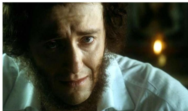
КАДР ИЗ ФИЛЬМА «ПОСЛЕДНЯЯ ДУЭЛЬ»