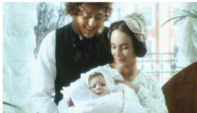
КАДР ИЗ ФИЛЬМА «ПОСЛЕДНЯЯ ДУЭЛЬ»

Как важно порой пересматривать этот фильм, чтобы лучше понять всю боль и глубину утраты и никогда о ней не забывать.