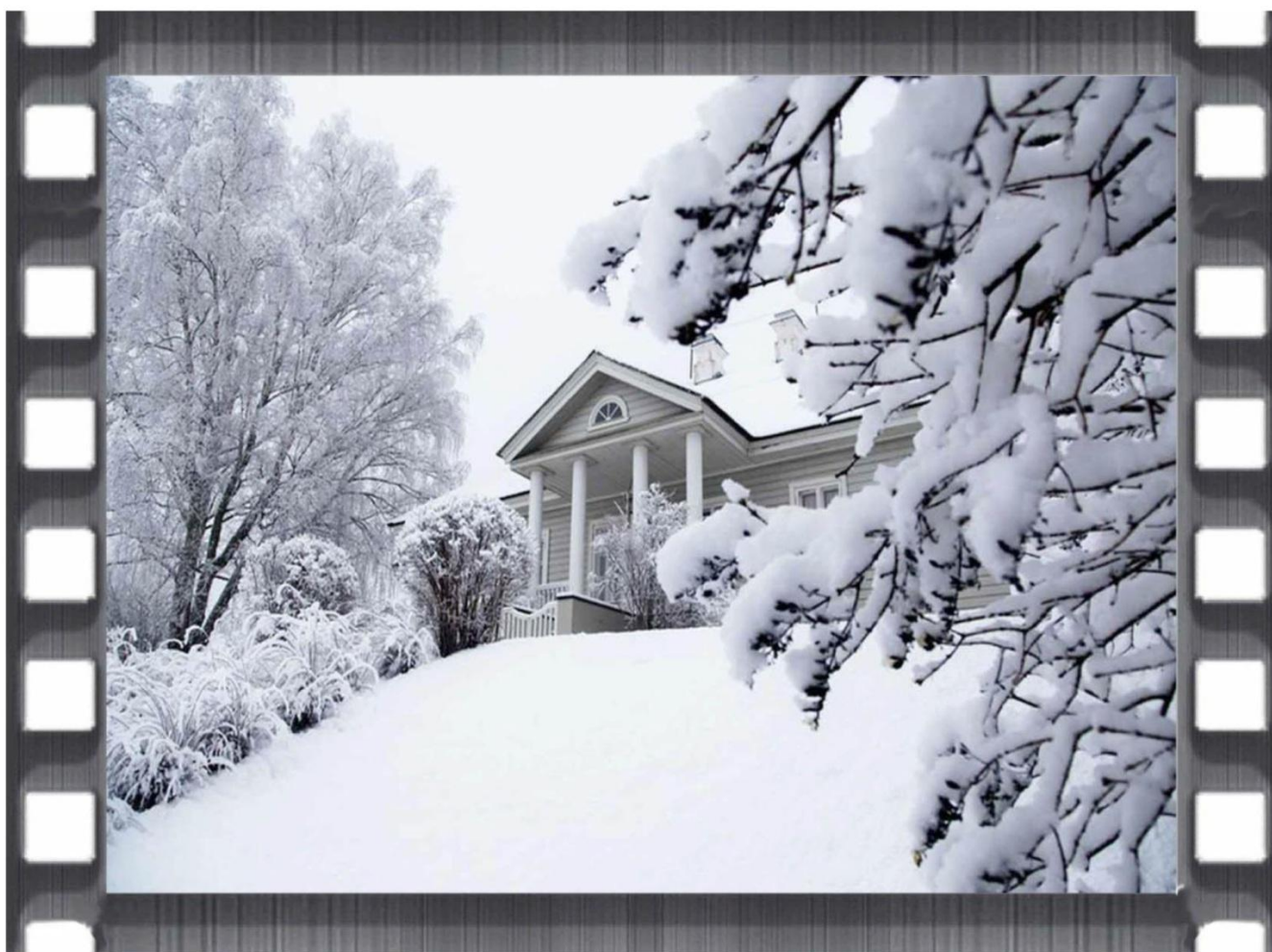
МИХАЙЛОВСКОЕ ЗИМОЙ.