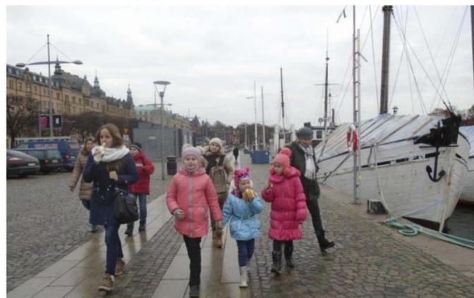
ПРОГУЛКА ПО СТОКГОЛЬМУ.

После знакомства с музеями вдоль великолепной набережной Страндвеген, созерцая ряды пришвартованных катеров и яхт, группа продолжила свою прогулку на Стадсхольмен к Королевскому дворцу.