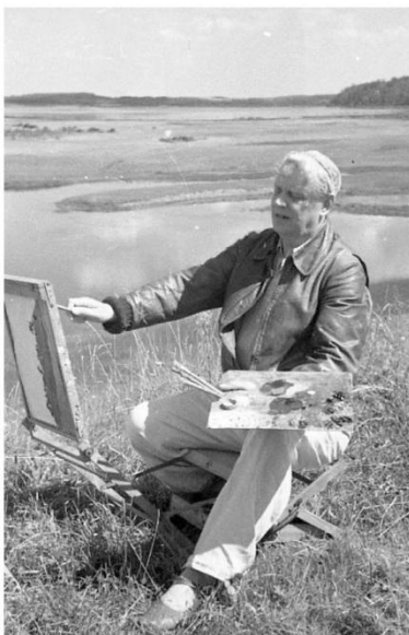
А. Н. САМОХВАЛОВ НА САВКИНОЙ ГОРКЕ

В 1955 году Самохвалов посетил пушкинские места вместе с известным живописцем Василием Васильевичем Мешковым (1893– 1963). Надо полагать, приезд в Михайловское был, в том числе, связан с работой над циклом иллюстраций к пушкинскому роману в стихах «Евгений Онегин». Из биографии Самохвалова известно, что «в 1950-х гг. он создает серию портретов жены, пишет картину "В филармонии", пейзажи, среди которых особой личностью отличается небольшая холст "Аллея Керн", решенный в изысканной сине-зеленой гамме, пронизанный поэтическим лунным светом». Сам художник вспоминал: «Я работал над иллюстрациями к "Евгению Онегину", ...любимейшего моего поэта... Работа эта была связана с тем, что летние месяцы в течение чуть ли не четырех лет я провел вблизи Михайловского...» Таким образом, на основании представленных данных можно датировать работу 1950-ми годами.