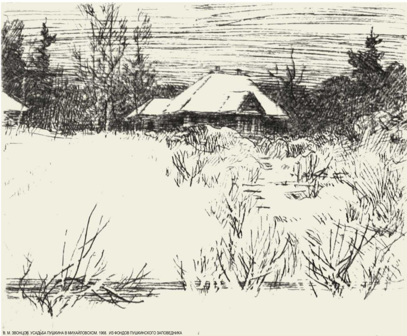
В. М. ЗВОНЦОВ. УСАДЬБА ПУШКИНА В МИХАЙЛОВСКОМ. 1968. ИЗ ФОНДОВ ПУШКИНСКОГО ЗАПОВЕДНИКА