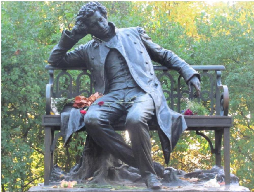
ПАМЯТНИК ПУШКИНУ В ЦАРСКОМ СЕЛЕ