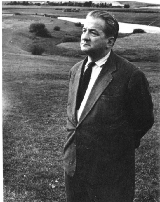
И. Л. АНДРОНИКОВ В МИХАЙЛОВСКОМ. 1975.

«Что привело нас сюда, на этот еще небывалый праздник – Всесоюзный праздник поэзии на Псковской земле? Любовь к Пушкину! Любовь вечная и всегда новая. Любовь благодарная и нежная, возвышенная и необыкновенно простая в своем бесконечно естественном ощущении Пушкина как живого, знакомого нашего человека и величайшего из поэтов, недостижимо совершенного в своем творчестве, и поэта глубоко современного, способного и сегодня ответить на тысячи наших душевных вопросов».