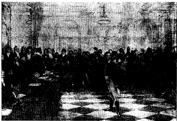
Пушкин на лицейском экзамене. Картина И. Е. Репина, 1911.

В галерее, соединявшей лицейский флигель с дворцом, помещалась библиотека : вдоль стен стояло 6 шкафов под красное дерево, заполненных книгами, несколько столиков, стулья, на стенах висели масляные лампы. Ныне лицейская библиотека восстанавливается в ее первоначальном виде.